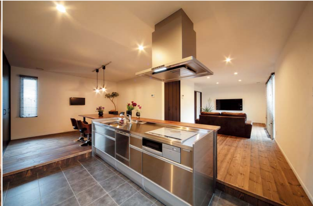
上／1階にあるLDK。キッチンの床は水や汚れに強い素材を採用。カウンターはアメリカンビンテージのテイストに合わせて古材風の木材カウンターを取り付けた 下左／ダイニングテーブルはキッチンの天板とフラットにつながるように計算。すっきりと、一直線に収まっている 下右／キッチン、リビングダイニングより一段下げて設置。ここに立つと部屋中が見渡せる